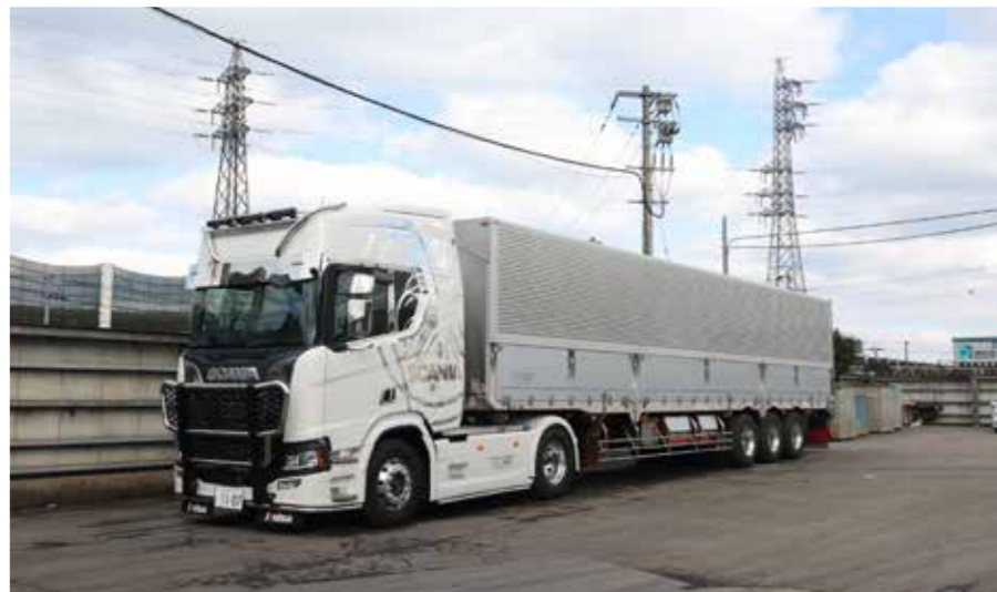
最新鋭のトラックを導入

まず当社の経緯からお話しますと、事業の原点は、私の祖父が営んでいた紙や布の問屋業です。戦後になると、焼け野原を元に戻すために鉄くずの收拾に着手して中山商店を設立。1970年代、西日本初となる鉄圧縮切断処理機を導入するなど、高度成長期を支えながらスクラップ処理業で業績を伸ばしました。さらに、1989年には父が、廃木材リサイクル事業の中山リサイクル産業株式会社を創業。「故里地球から戴いた資源を自然に帰すそれが私達の使命です」をモットーに企業活動はスタートしました。