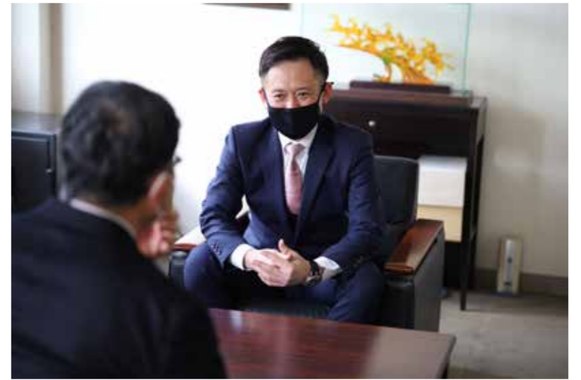
対談中の中山社長

とはいえ、地球環境保全の問題を、産業廃棄物処理事業者とそれを取り巻く業界だけで「何とかする」のは、限界に近づいているともいえます。つまり、あらゆるモノを作る段階で、破棄・処分まで考慮に入れて設計と製造を行えば、不要な排出物を減らせ、処分する方法に対する認識を使う側がもたやすくなる