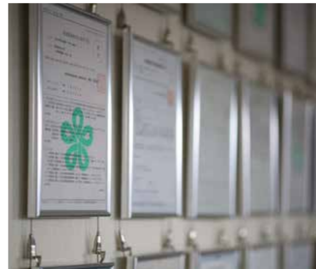
全国数多くの自治体にて許可を取得している

地球環境を保全する全体規模の活動へ向かうにあたって、産業廃棄物処理業界はまず、現在の価格競争から脱却して「発信力」のある立場へと進化する必要があります。そしてまず、私たちは「作る人」と「使う人」に対して、さまざまな形で発信していくべきだと考えます。 当社ではたとえば、自社ホームページ上で